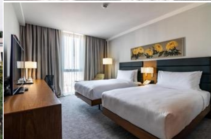
พักที่ Hilton Garden Inn หรือเทียบเท่าระดับ 4 ดาว (3 คืน ***คืนที่1,4,5)